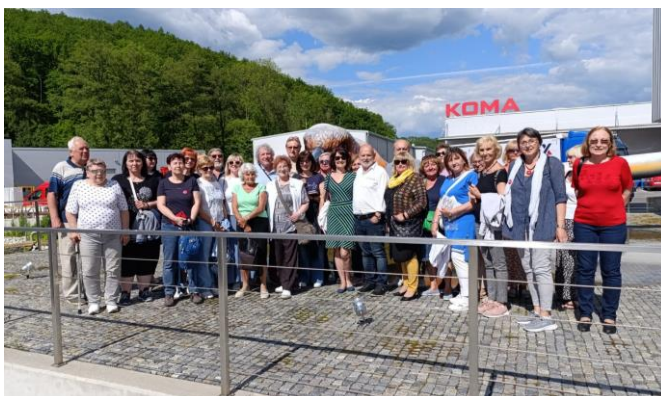
Exkurze: Vizovice - Koma, květen 2024

Garantuje Fakulta multimediálních komunikací