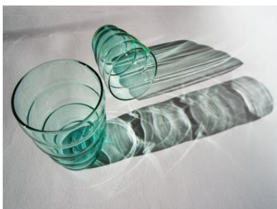
09-2022 výstava Digitální fotografie U3V: zde Vystavené fotografie

Přenesení souborů do počítače. Formáty souborů pro ukládání. Výběr, třídění a archivace fotografií.