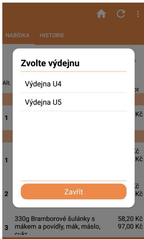
Obr. 4 – nabídka Zvolte výdejnu – volba konkrétní výdejny

Záložku „NABÍDKA“ lze vidět na Obr. 3. Tato záložka obsahuje zobrazení aktuální dostupné nabídky jídel ve výdejně v daný okamžik s uvedením ceny jídla. V dolní liště (v zápatí) aplikace je zobrazen aktuálně přihlášený uživatel (v levém rohu) a finanční zůstatek (v pravém rohu).