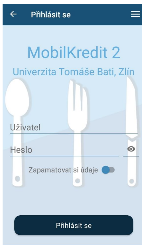
Obr. 2 - obrazovka pro přihlášení

Do aplikace MobilKredit 2 se přihlásíte se svým uživatelským jménem a heslem UTB .