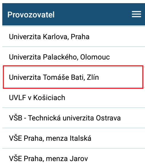
Obr. 1 - volba provozovatele