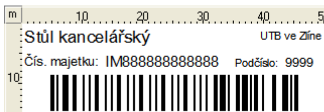
Obr. 1 – majetek standard (50x15 [mm])

Čárový kód majetku obsahuje: název, inventární číslo vč. podčísla, název VVŠ.